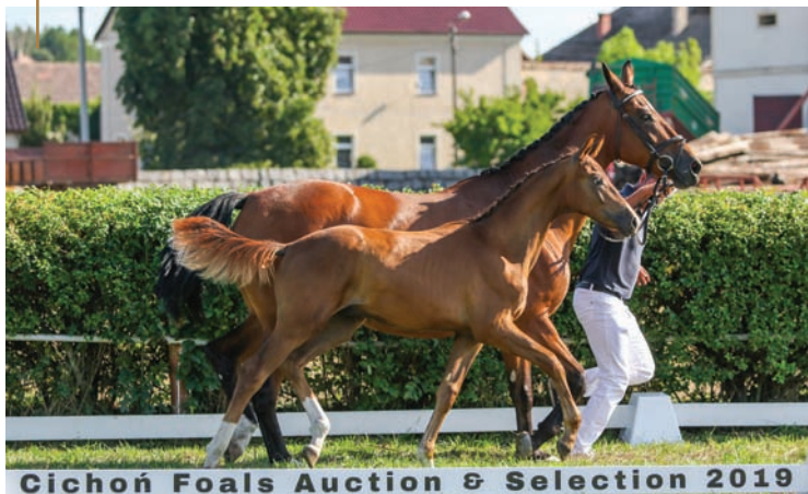
Cichon Foals Auction & Selection 2019

Każda z tych matek to przemyślane skojarzenie, które jest wynikiem ciężkiej pracy i wieloletniego doświadczenia. Fundament naszej hodowli tworzą konie ras rodzimych, które w połączeniu z zachodnimi reproduktorami dały rzeszę wspianego potomstwa, odnoszącego sukcesy sportowe w kraju i za granicą.